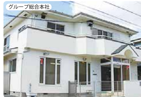
グループ総合本社

弊社までの地図は、ホームページから Google Map でより詳しくご覧頂けます。